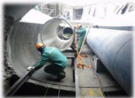
Démontage ancienne conduite dans le passage sous Dranse