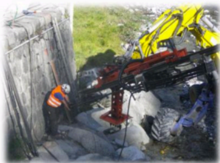
Forages pour l'installation du Blondin