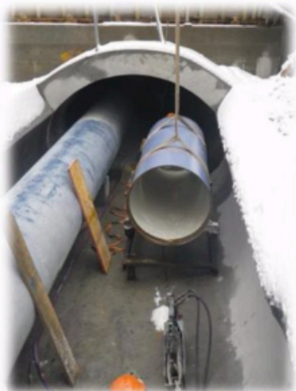
Nouvelle conduite passage sous Dranse