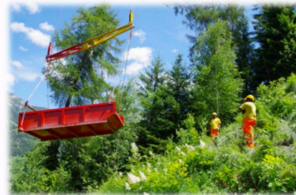
Transport de charge avec le blondin de chantier